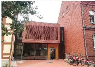
2 Ev. Gemeindezentrum: Kirchplatz 6