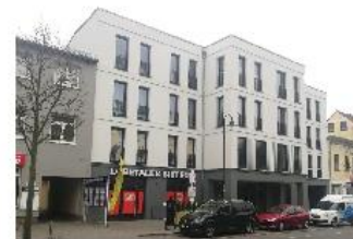
5 Hoffnungstaler Stiftung: Breitscheidstr. 17