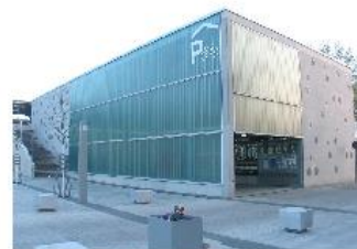
6 Fahrradparkhaus: Bahnhofsvorplatz