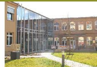
4 Bibliothek/Treff 23: Breitscheidstr. 41-43