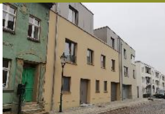
1 Priv. Wohnungsbau: Hohe Steinstr. 22-24