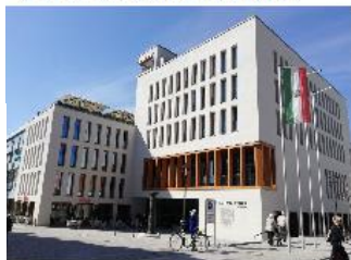
3 Neues Rathaus: Bürgermeisterstr. 25